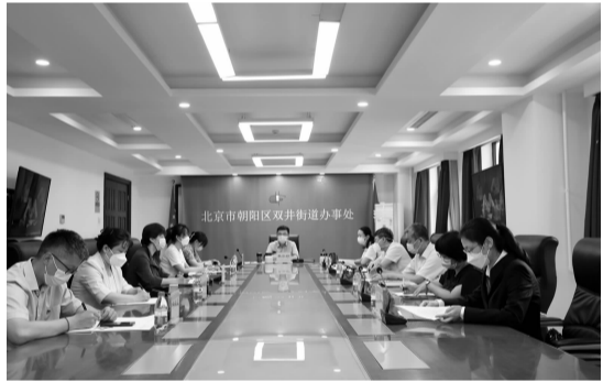
区人大代表年中集体活动双井分会场