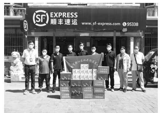
街道总工会慰问地区快递小哥

据统计,截至7月19日下午16:00,五个地块77户全部签订意向书,签约率达100%。